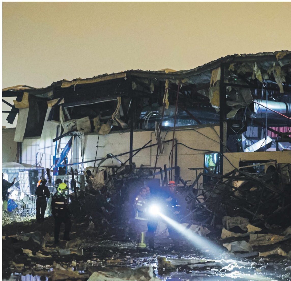
▲ PROGNOŽU platformas ir padarījušas par spēli jebkuru sociālās dzīves aspektu gan individu, gan starp nopietnām, analītiskām prognozēm un azartspēļu likmēm. 2026. gadā ir bijuši vairāki aizdomi karadarbību Tuvajos Austrumos.